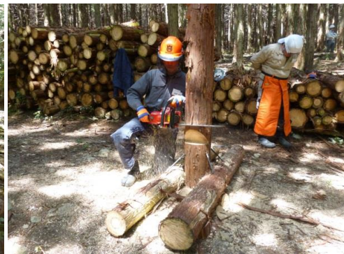
12_実地講習・受け口