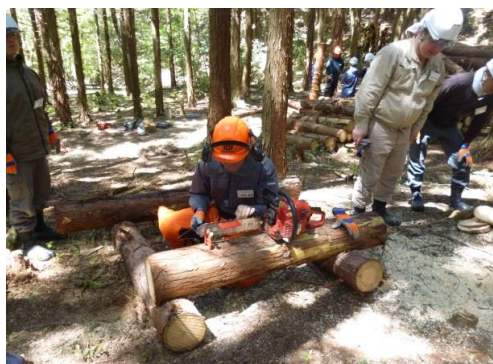
10_実地講習・チェーンソー整備