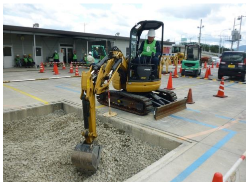
7_小型車両系建設機械特別講習