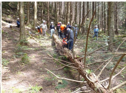
14_実地講習・枝払い