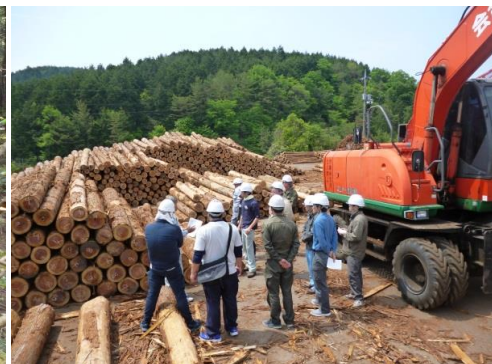
15_施設見学・三次木材共販所