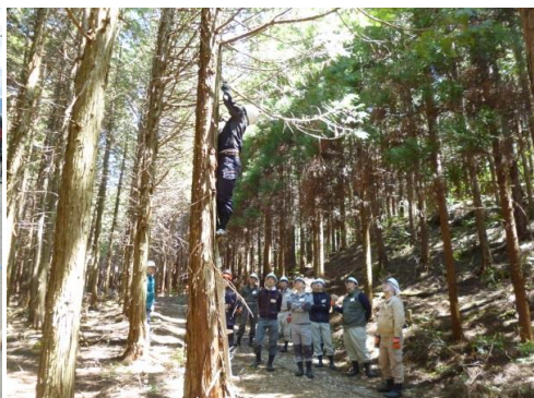
8_実地講習・枝打ち