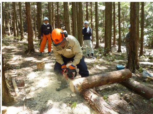
11_実地講習・玉切り