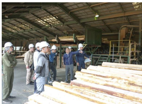
16_施設見学・広島県北部 国産材加工協同組合