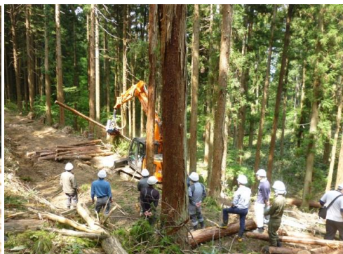
17_現場見学・三次地方森林組合 作業現場