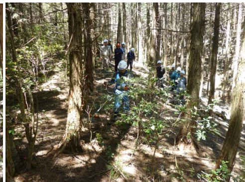
9_実地講習・刈払い